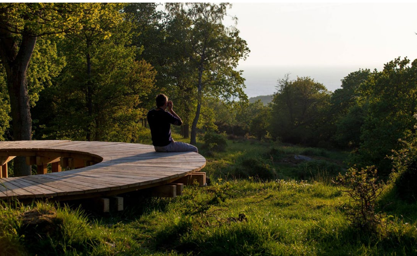
Hammersholm, Erik Brandt Dam arkitekter ApS.