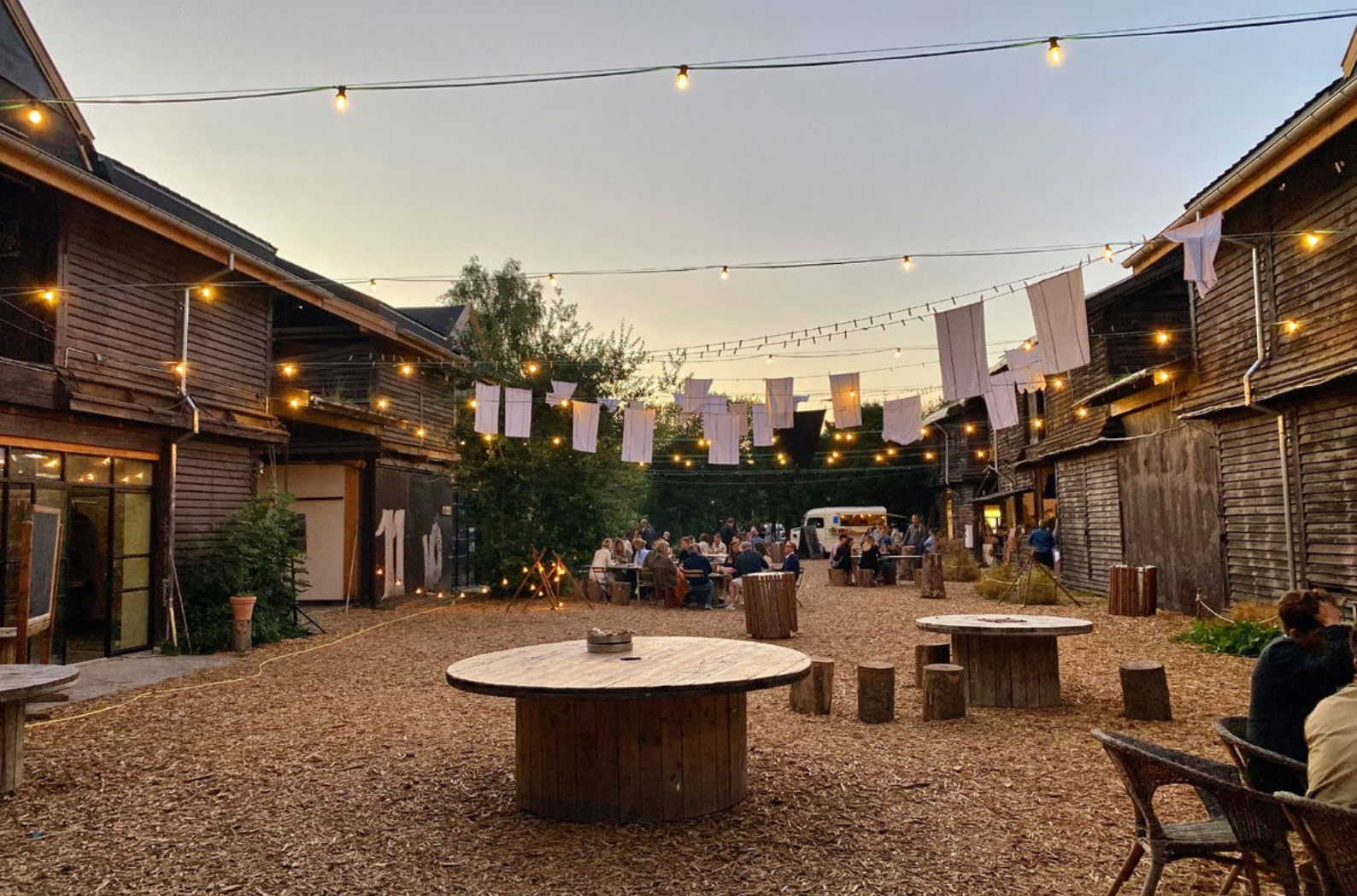
Banegaarden, Rønnow Arkitekter.