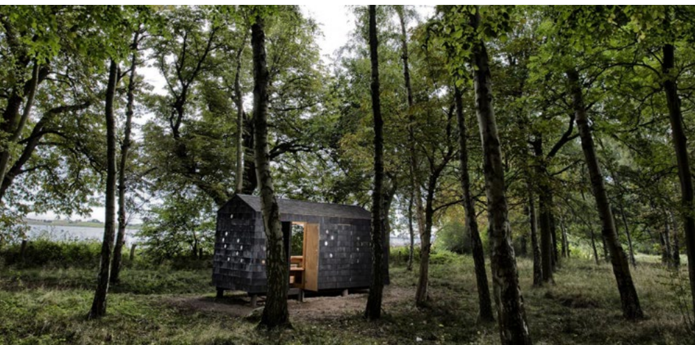
Shelter: LUMO Arkitekter;.

Før I går i gang med planlægningen, så husk at overveje hvilken målgruppe, I først og fremmest henvender jer til, og hvorfor de er interesserede i arrangementet. Arkitekturens Dag tiltrækker traditionelt den arkitektur- og kulturinteresserede borger, men kan også målrettes fx skoleelever, unge, fagfolk, naturinteresserede eller potentielle tilflyttere. Sørg for, at arrangementet skrues sammen, så det er relevant for dem, I henvender jer til – både i form og indhold.