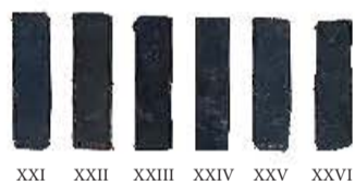
XXI-XXVI: Blodstrøgen mursten produceret i Danmark af dansk rødler Brændt reducerende v. 1050 grader Brændt i tunnelovn Sorteret fra pga for lille restlager